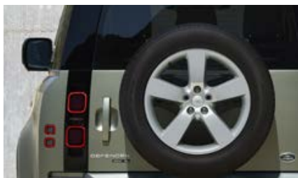
20" (wzór 5098) - Polished Silver 3